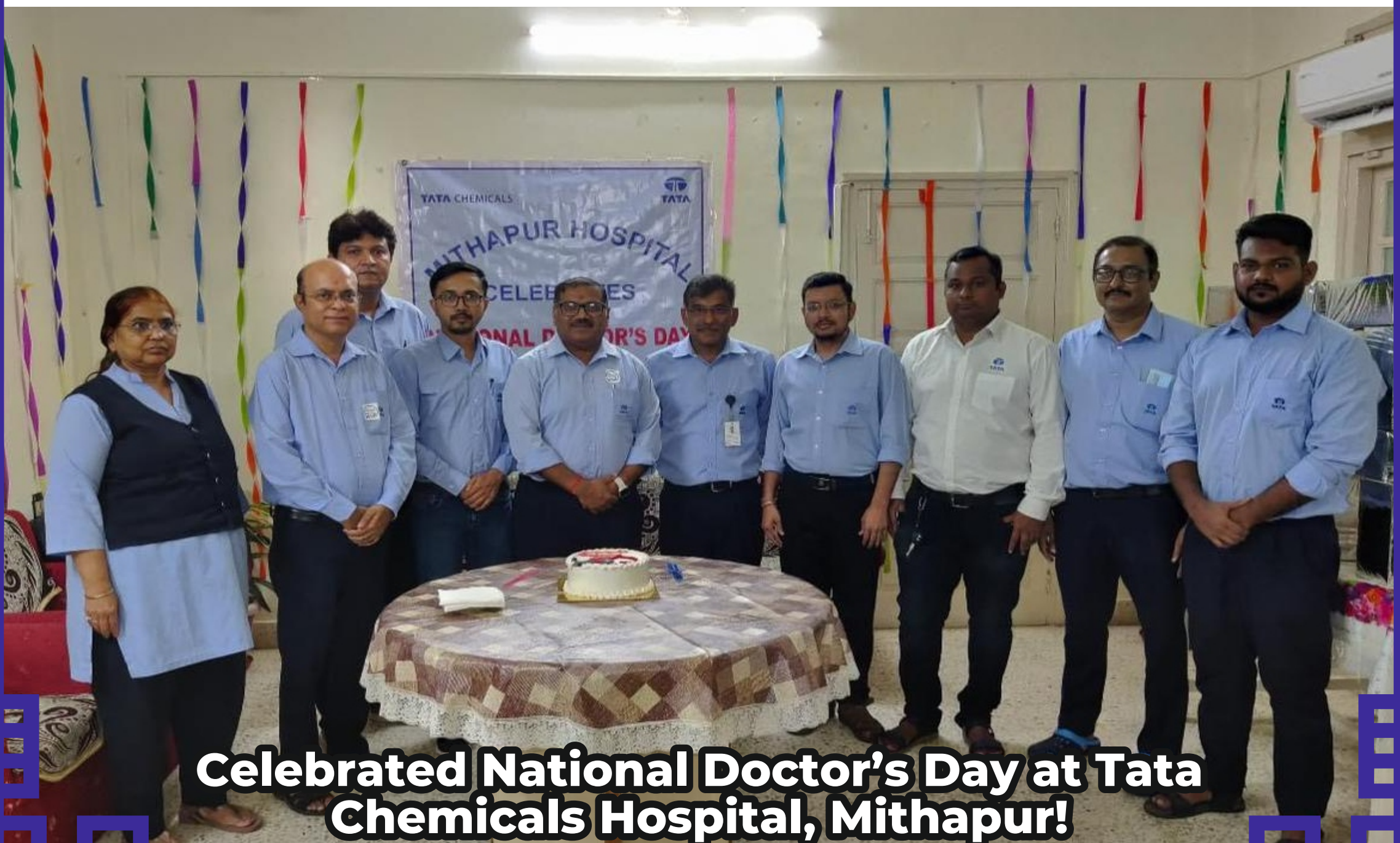
Celebrated National Doctor's Day at Tata Chemicals Hospital, Mithapur!